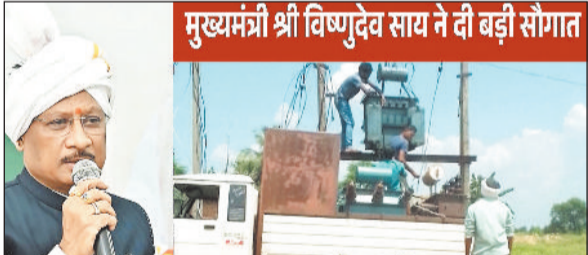
क्षेत्र में एक और बड़ी उपलब्धि हासिल हुई है। 400 केवी उपकेंद्र कुनकुरी के हरांडंड में प्रदेश का 5वां सबसे बड़ा 400/220 केवी का अत्याधुनिक उपकेंद्र स्थापित किया जा रहा है। साथ ही नए सब-स्टेशन (33/11 KV): ये सब-स्टेशन सलिहाटोली, विपतपुर, भगोरा, समडमा, मैनी, रेडे, पालीडीह, खुट्टरा एवं चेटवा सहित अन्य स्थानों पर निर्मित किए जाएंगे एवं उच्च क्षमता केंद्र- फरसाबहार और झिक्की बगीचा में 132/33 केवी के सब-स्टेशन स्वीकृत हैं। इन योजनाओं के लागू होने से बिजली की गुणवत्ता में सुधार होगा साथ ही लो वोल्टेज और ट्रिपिंग की समस्या कायों को गति मिलेगी तथा ग्रामीण जीवन स्तर में सुधार आएगा, विद्युत विभाग में बड़ी सौगत मिलने के बाद जिले भर में खुशी का माहौल है। स्थानीय लोगों ने मुख्यमंत्री विष्णुदेव साय का आभार व्यक्त करते हुए इसे क्षेत्र के विकास की दिशा में एक बड़ा कदम बताया है।

मुख्यमंत्री विष्णुदेव साय के नेतृत्व में जिले को विद्युत विकास के