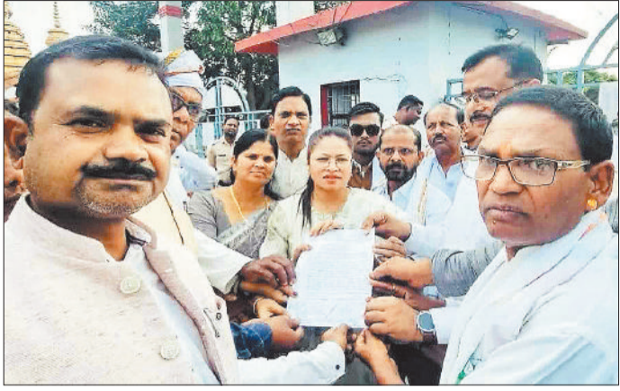
शक्कर कारखाना प्रबंधन को ज्ञापन सौंपते किसान व कांग्रेस पदाधिकारी।

शक्कर कारखाने से जुड़े गन्ना उत्पादक किसान और वहां कार्यरत मजदूर पिछले कई महीनों से अपने बकाया भुगतान करने की मांग कर रहे हैं। किसानों का कहना है कि उन्होंने समय पर गन्ना आपूर्ति की, लेकिन उनका भुगतान अब तक लंबित है, जिससे उनकी आर्थिक स्थिति बिगड़ती जा रही है। मजदूरों का आरोप है कि उन्हें मेहनताना समय पर नहीं मिल रहा, जिससे उनके परिवारों का भरण-पोषण करना कठिन हो गया है। कई