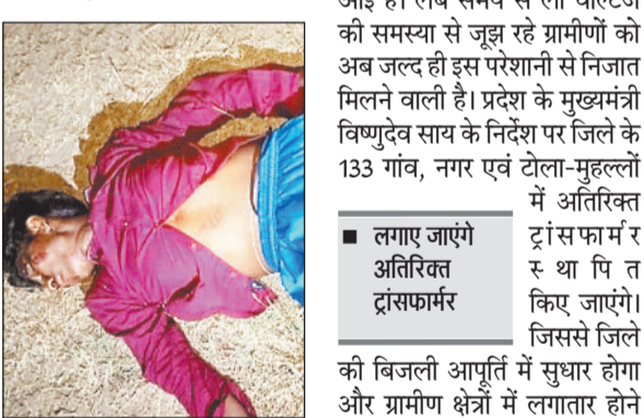
और घायलों को 108 एम्बुलेंस की मदद से कोतबा अस्पताल पहुंचाया गया, जहां उनका इलाज जारी है। पुलिस ने मृतक के शव को कब्जे में लेकर पोस्टमार्टम के लिए भेज दिया है। फिलहाल पुलिस हादसे के कारणों की जांच कर रही है।

हादसा इतना भीषण था कि राहगीर की मौत पर ही मौत हो गई। प्रत्यक्षदर्शियों के मुताबिक बाइक काफ़ी तेज रफतार में थी और चालक नियंत्रण खो बैठा, जिसके बाद यह हादसा हुआ। दुर्घटना में बाइक चला रहा युवक और उसके पीछे बैठा एक अन्य युवक भी गंभीर रूप से घायल हो गए। घटना की सूचना मिलते ही तुमला थाना पुलिस मौके पर पहुंची