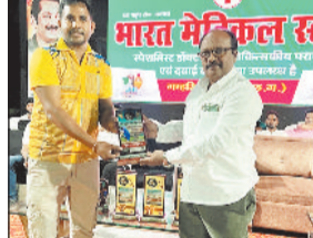
ऑलराउंड प्रदर्शन करते हुए मैन ऑफ द मैच का खिताब हासिल किया। दूसरा मुकाबला ऋषु क्लब सिमडेगा और स्टार 11 सन्ना के बीच खेला गया। ऋषु क्लब सिमडेगा ने टॉस जीतकर पहले गेंदबाजी चुनी। स्टार 11 सन्ना ने निर्धारित 10 ओवर में 7 विकेट खोकर 105 रन बनाए। लक्ष्य का पीछा करते हुए ऋषु क्लब सिमडेगा की टीम ने 9 ओवर में 3 विकेट खोकर 105 रन बनाते हुए 7 विकेट से शानदार जीत दर्ज की।