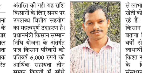
अंतरित की गई। यह राशि किसानों के लिए समय पर उपलब्ध वित्तीय सहायता का महत्वपूर्ण उदाहरण है। प्रधानमंत्री किसान सम्मान निधि योजना के अंतर्गत पात्र किसान परिवारों को प्रतिवर्ष 6,000 रुपये की आर्थिक सहायता तीन समान किश्तों में सीधे उनके बैंक खातों में प्रदान की जाती है। यह सहायता किसानों को खाद-नीच की खरीद, मजदूरी भुगतान एवं अन्य कृषि कार्यों में समय पर निवेश करने में सहायक सिद्ध हो रही है, जिससे खेती की निरंतरता और उत्पादकता बनी रहती है। जशपुर जिले के कई किसान इस योजना

जशपुर जिले में इस योजना का व्यापक प्रभाव देखने को मिल रहा है, जहां 71,733 किसान इससे प्रत्यक्ष रूप से लाभान्वित हो रहे हैं। मार्च 2026 में इस योजना की 22वीं किश्त जारी की गई, जिसके अंतर्गत छत्तीसगढ़ के 24 लाख 71 हजार किसानों के खातों में 498.83 करोड़ रुपए की राशि सीधे